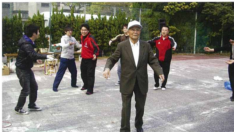
御年97歳！若者たちもタジタジでした。