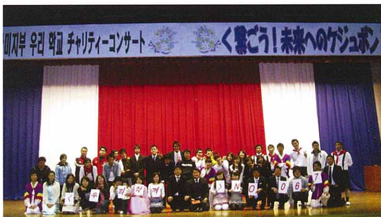
完全燃焼の出演者たち