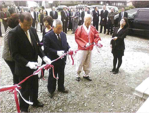
10月31日(日)に行われた開所式の様子

お問い合わせは 052（611）2862までお気軽にご相談ください。専門スタッフが親切に対応いたします。