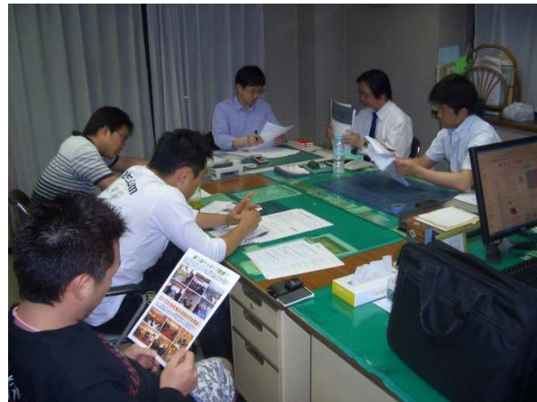
青商会常任幹事会の模様