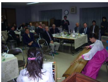
「MU」による民族楽器の演奏