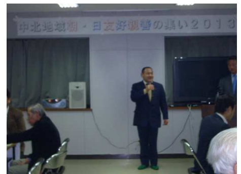
挨拶される市議会議員の方々