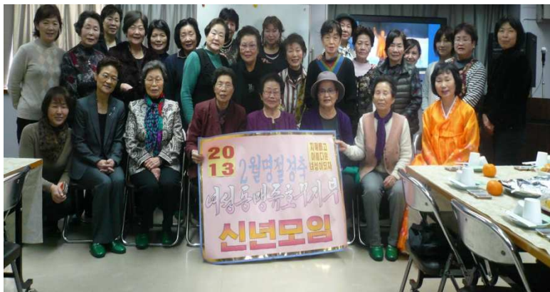
皆さん揃っての記念撮影です。