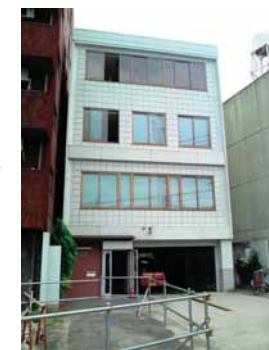
〒732-0803 広島市南区南蟹屋1-3-30