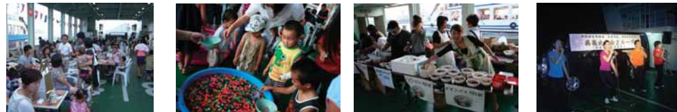
当日はこんなにたくさんのお客さんが！オモニたちの料理は最高。歌舞団公演も開放的な雰囲気であつたり…

その後始まった花火大会、約1時間という短い時間でしたが、みなさんが口をそろえて「楽しかった」「またこういうイベントがあればいいい」など、満喫した様子でした。