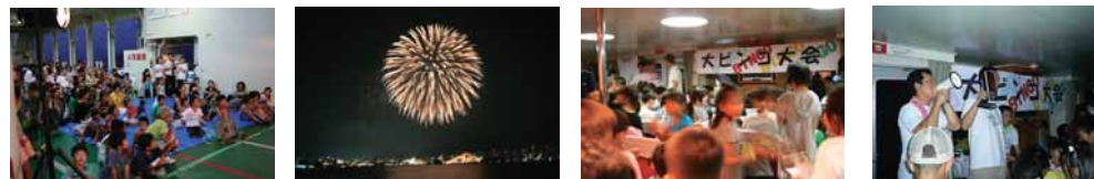
いよいよ花火大会がはじまり、海の上での花火にくぎ付け!!帰りはピンゴ大会で大盛り上がりでした。