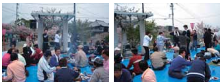
尾道一千光寺公園にて。花見といえば、みんなで焼肉！