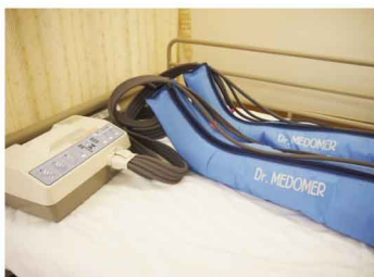
血行促進、疲労回復、神経痛と筋肉痛の緩和に効果のある 《Dr. MEDMER》

「ありらんの家」は、今秋9月で5カ月を迎えます。開所より今日まで、利用者様の「元気・楽しい・安心」をモットーに、心のこもったサービスを心がけてまいりました。先日、開所記念で利用者様とご家族様、地域や同胞の方々から寄贈していただいた運動機器が届き、利用者の方々も大変喜んでおられます。高齢者が抱える病には、運動やマッサージを行うことで痛みを軽減できるものもあるので、自立した生活を送りたいと思っておられる高齢者の、力強い味方になります！いつもありらんのアボジオモニ達を応援してくださり職員一同心より感謝しております。コマッスンミダ。