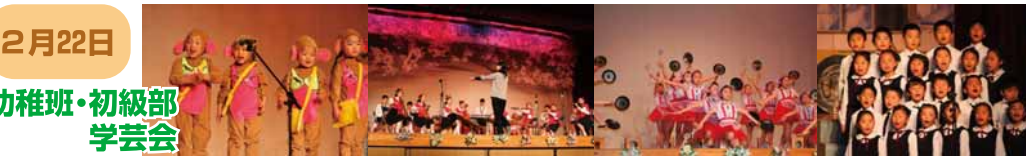
2月22日 幼稚班・初級部 学芸会 約300人の保護者・同胞をむかえ、この日のために一生懸命練習した歌や踊り、劇などに彩られた、躍動の舞台を繰り広げました。一世の方々も多く来られ、児童園児の元気で華やかな舞台に目を細めていました。