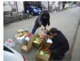
支援活動をする同胞青年