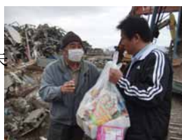
↑中村建設作業場にて