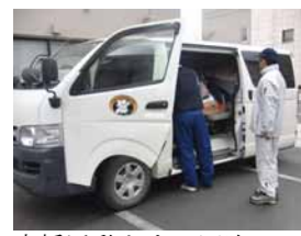
支援活動をする同胞