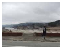
同胞会社跡(三陸町)