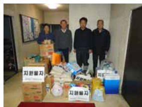
総聯中央、秋田本部からの救援物資