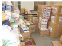
本部に届いた 救援物資

現在、全国のウリ同胞が、東日本大震災で被災された同胞たちへの支援活動を行なっています。岩手県本部にも県内・県外から多くの支援物資が届いています！