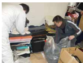
支援活動をする青商会員