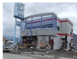
同胞店舗(大船渡町)