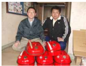
駆けつけた総聯函館支部