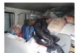
3月21日に届けた支援物資