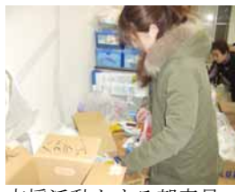
支援活動をする朝青員