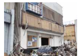
同胞店舗(大船渡町)