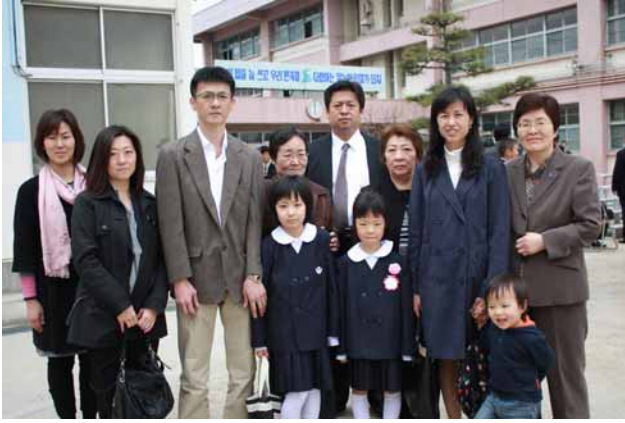
侑那ちゃん、愛那ちゃんを祝う家族 岩手から駆け付けた委員長たちと共に

侑那ちゃんはこれまで大船渡の日本学校に通いながら、朝大生が講師を務めるインターネット教室「ナルゲ」でウリマルに親しんできた。2人は朝鮮学校に通うことについて楽しみにしていたという。式当日には本部委員長、女性同盟委員長らが岩手から駆け付け共に入学をお祝いした。