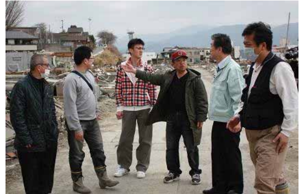
南昇祐副議長(右から2番目)と被災地を見て回る同胞たち

この日はまず総連中央の南昇祐副議長が岩手を訪れ被災した同胞を慰問した。7日の夜に起こったM7.4の余震の影響で、当日朝の時点で県内は全域に渡り停電していた。信号も点かないなか被災地に向かった一行は、同胞の自宅や避難所へ各地から送られてきた救援物資を届け、流失した自宅や店舗を見て回った。南昇祐副議長は同胞たちに現在の生活や急ぎの問題が無いかなどを聞き、金正日総書記から送られた慰問金を手渡した。