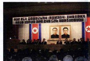
東日本大震災・慰問金感謝大会