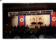
慰問金感謝大会(3月)