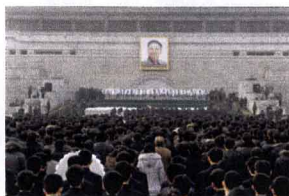
金日成広場に集まる祖国人民

一生をかけ祖国と人民、在日同胞に多くの指導と愛情をくださった金正日総書記をもっとも敬虔な心で追慕し、ご冥福をお祈り申し上げます。