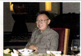
金正日総書記が逝去(12/17)