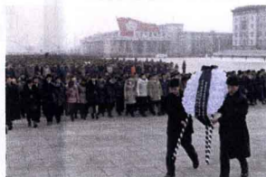
花輪を進軍する市民達