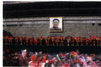
光明星節の朝-平壤(2/16)

毎月25日発行 0円 同胞生活情報誌 ハナ korea-iwate@ictnet.ne.jp