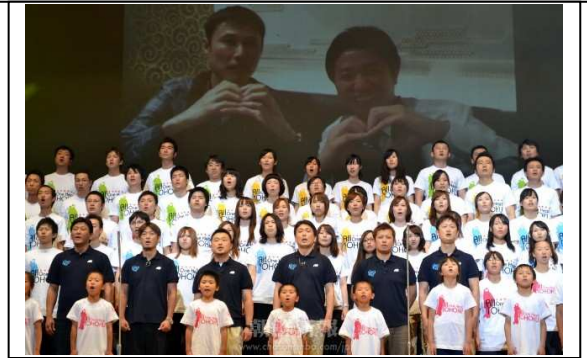
フォーラムエンディングの場面

■宮城、福島、青森、岩手、秋田、山形の東北6県青商会が共催する「ウリ民族フォーラム2012in 宮城」が24日、宮城県仙台市の仙台市民会館で行われた。総聯中央の許宗萬議長、南昇祐副議長、呉民学経済局長、東北地方の総聯本部委員長をはじめとする活動家と同胞、商工連合会、朝青中央、女性同盟中央、留学同中央をはじめとする中央団体活動家と同胞、そして青商会中央の洪萬基会長をはじめとする青商会会員ら1600余人が日本各地から参加した。