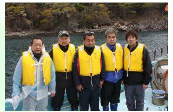
8年ぶりの船釣りの会-しかも大漁(5/15)

毎月25日発行 0円 同胞生活情報誌 ハナ songsu75@yahoo.co.jp