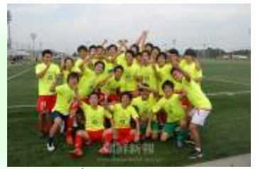
関東社会人リーグを制覇しJFL昇格に挑むFCコリア

毎月25日発行 0円 同胞生活情報誌 ハナ songsu75@yahoo.co.jp