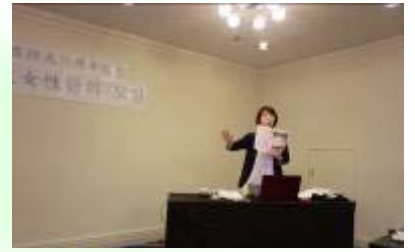
女性同盟結成70周年記念講演会(7/5)

毎月25日発行 0円 同胞生活情報誌 ハナ songsu75@yahoo.co.jp