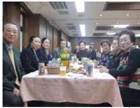
川崎では、8名が参加しました。