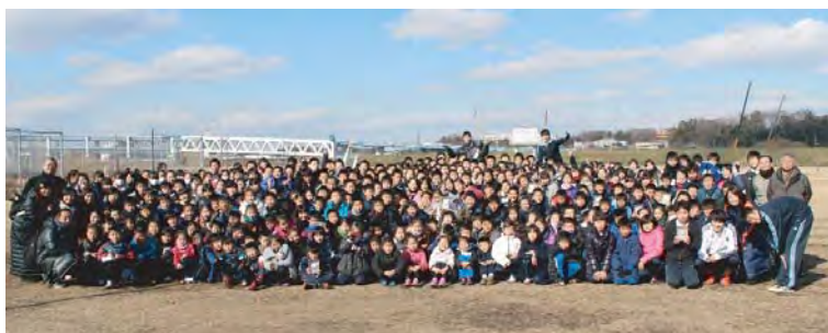
参加した学生たちで記念撮影♪

オール神奈川で精神で催された今大会が、より幅広い同胞たちの交流の輪を広げてくれる可能性を感じました