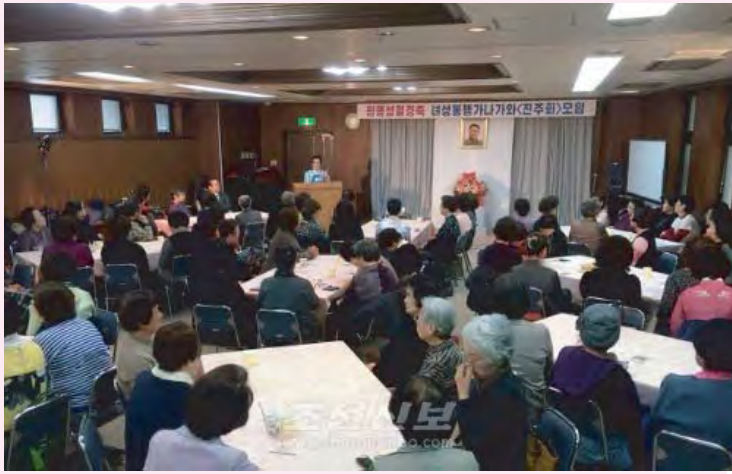
90名が参加した<真珠会>の集い

女性同盟神奈川顧問会が主催する光明星節慶祝<真珠会>の集いが、県本部会館6階講堂にて行われました。この日は同胞女性、県、中央の委員長、副委員長ら90名が参加し行われました。