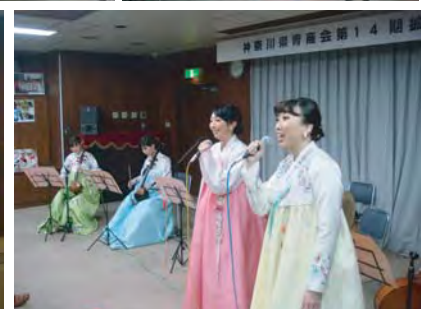
民族楽器アンサンブル集団<MU>ミュウによる公演大いに盛り上がりました♪