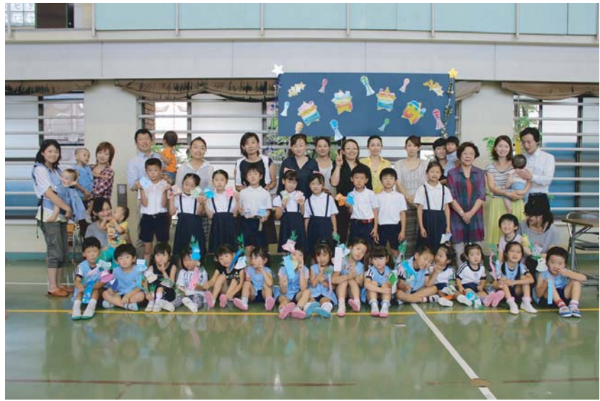
参加した子どもたちと、アッパ、オンマと一緒に記念撮影☆