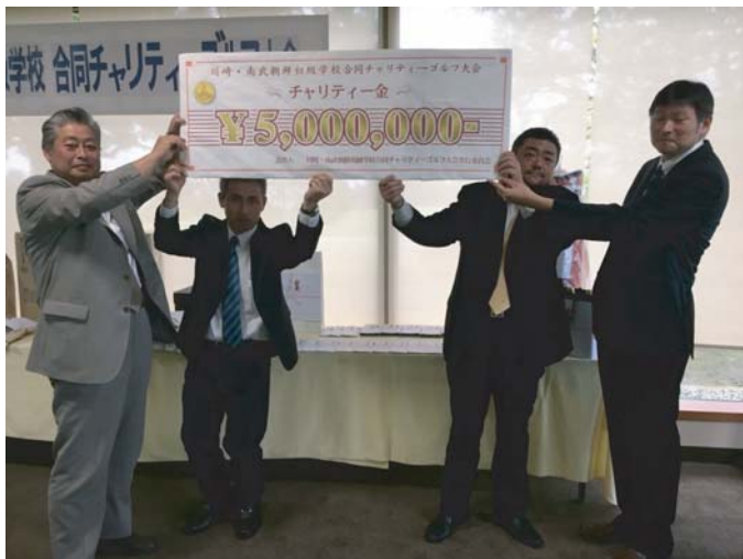
合同実行委員長より南武・川崎校長へ チャリティー金が授与されました。

この日、南武学校と川崎学校の合同チャリティーゴルフコンペが行われました。昨年まで各校ごとに行っていたコンペを、今年は合同で行うことに決めて開催を準備してきました。当日は台風で悪天候にもかかわらず118名の方々が参加して下さいました。