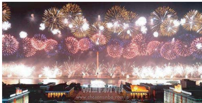
大同江水上ステージ公演のクライマックス

朝鮮労働党の70回目の誕生日を祝う、国を挙げての一大祝賀行事は、70年間、良い時代も厳しい時代も、変わらず党と共に歩んできた人民らへ贈る、史上最大級のプレゼントとなった。朝鮮人民軍閲兵式および平壤市民パレードや青年たちによるトーチマーチ(10日)、大同江水上ステージでの大公演(11日)など、華やかな一連の行事は終始熱気にあふれ、人々の表情には歓喜の笑顔、涙があふれていた。