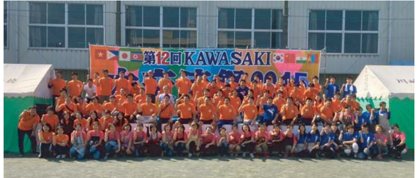
当日スタッフ全員で記念撮影

また9月に行われたチャリティーコンペの1部を東日本大震災復興支援金として南武教育会会長が伝達するセレモニーも行われた。