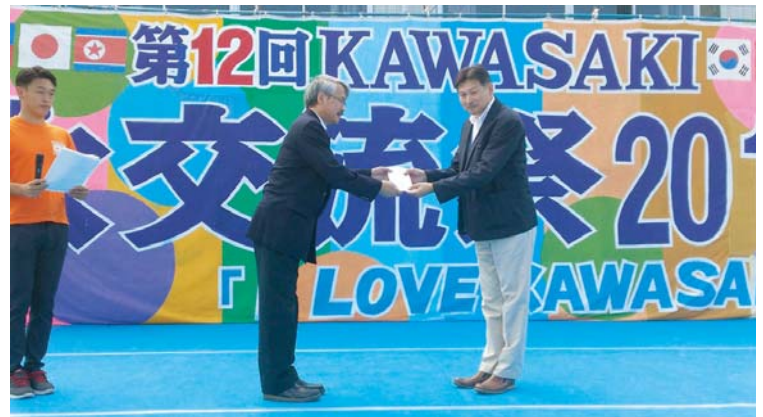
震災復興支援への支援金伝達セレモニー