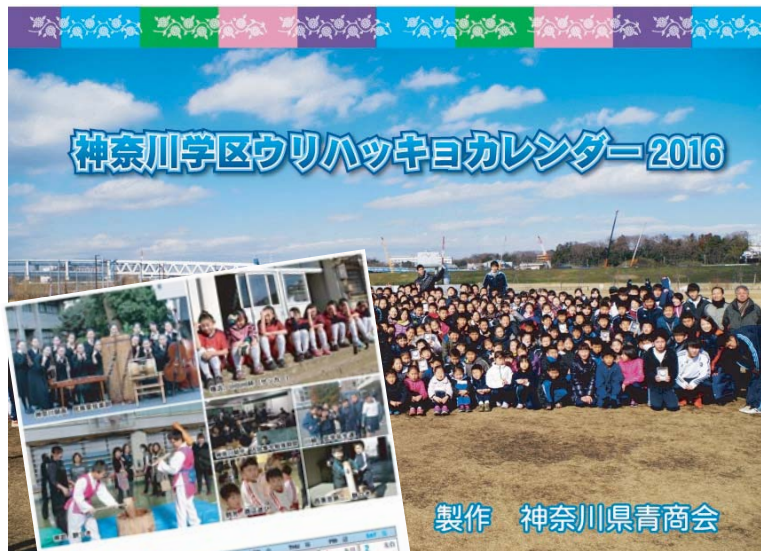
製作 神奈川県青商会

県青商会製作 絶賛販売中! 1,000円 (税込) 詳しくは支部、又は 南武青商会まで!