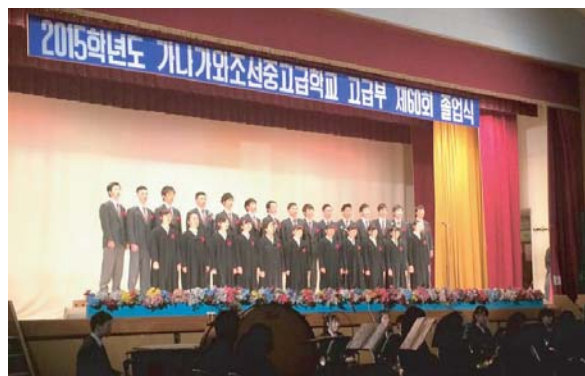
高級部 卒業公演の一幕

学校創立65周年の年の卒業生として胸を張って、卒業式に参加した学生たちは、ウリハッキョで学んだことを誇りに、これからも同胞社会の担い手として各方面で活躍してゆく決意を披露しました。卒業生たちの前途に輝かしい未来が広がることを心から願っています！