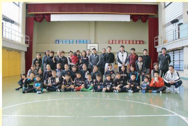
アボジ・オモニと一緒に記念撮影☆