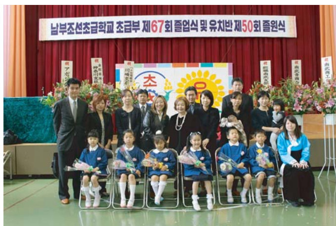
幼稚園を卒園した6名の園児と学父母