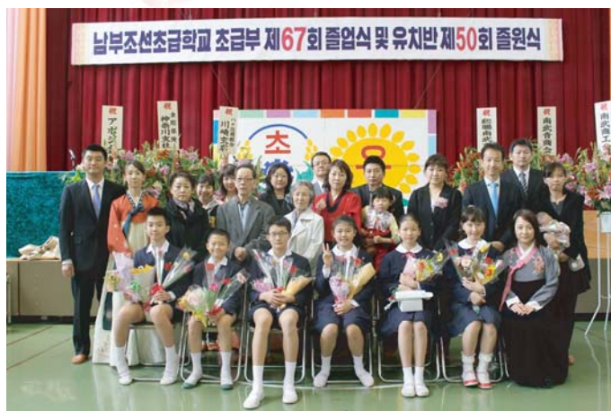
初級部を卒業した6名の学生たちと学父母