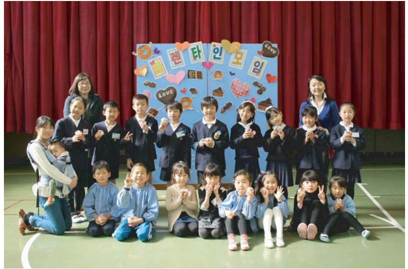
手作りしたカップケーキを持って記念撮影☆