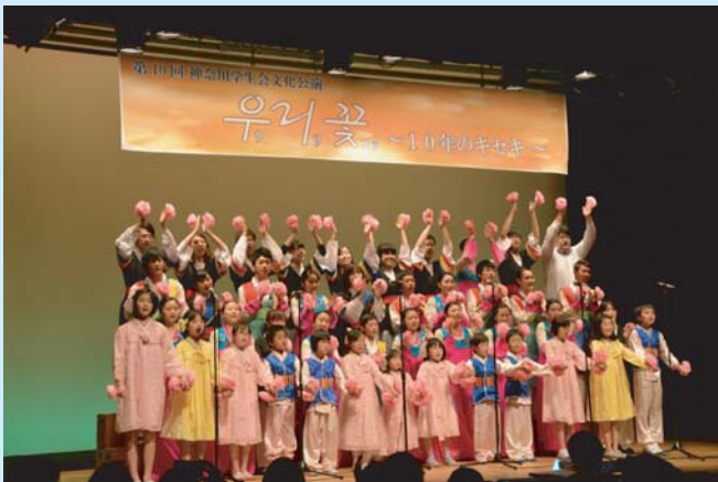
学生会OB/OGも参加して大成功に終わった文化公演

第10回文化公演を開催するにあたって、惜しみないご協力と変わらぬご声援をくださったすべての南武地域同胞ヨロブンへ、この場を借りて改めて感謝の挨拶をしたいと思います。