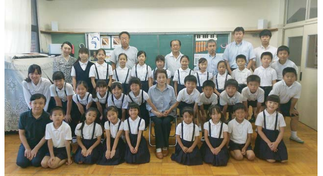
学生たちと一緒に記念撮影