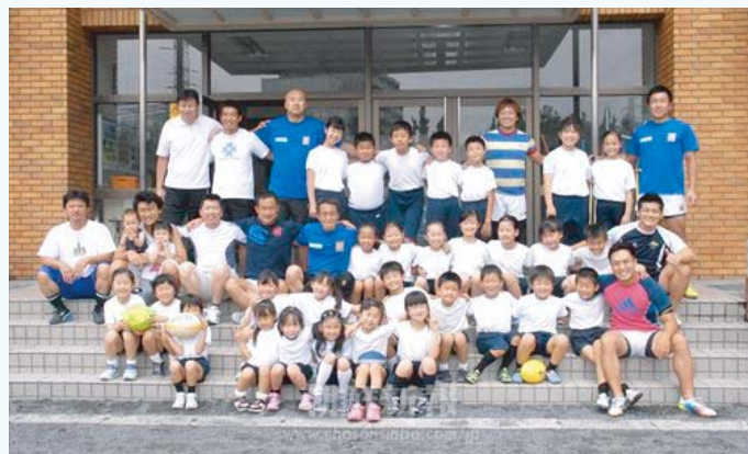
ラグビー教室終了後に学生たちと「凱旋クラブ」南武青商会メンバーで記念撮影☆