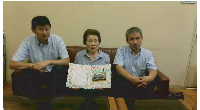
学生たちの感謝の手紙を写真に添えてプレゼント