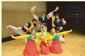
共演した朝高生と一緒に