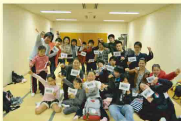
青商会の差入れを手に一枚