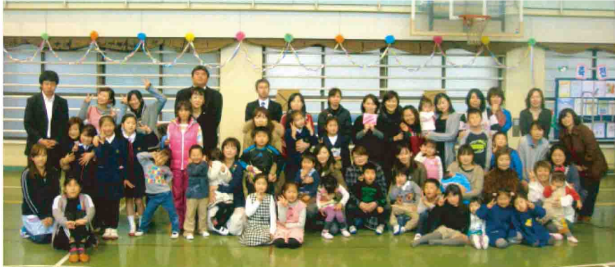
約75名の参加者で大成功に終わった祝賀会☆

女盟南武支部が卒業・入学生たちを祝って恒例の祝賀パーティーを南武学校体育館にて行いました。