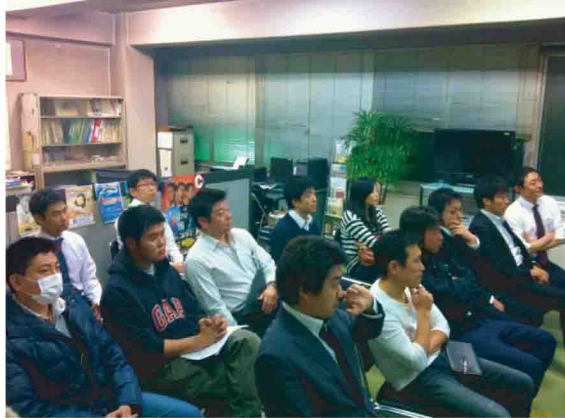
講義の内容に大満足だった参加者たち

南武青商会第9期初めてとなる<勉強会>が15名が参加し行われました。講師として直前会長に登場して頂き、身近な問題として構造設計と耐震診断について講義して頂きました。とても分かりやすく、また具体的な内容で参加者たちは食入る様に聞き入っていました。また、講義後の質疑応答でも矢継ぎ早に質問が飛び交い、講義の内容の素晴らしさを物語っていました。