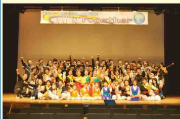
公演後出演者たちと