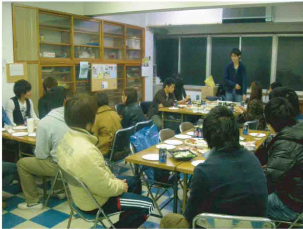
先輩朝青員たちの熱い思いに、卒業生たちも感動! (写真右下)朝青活動紹介を聞く卒業生と朝青員たち