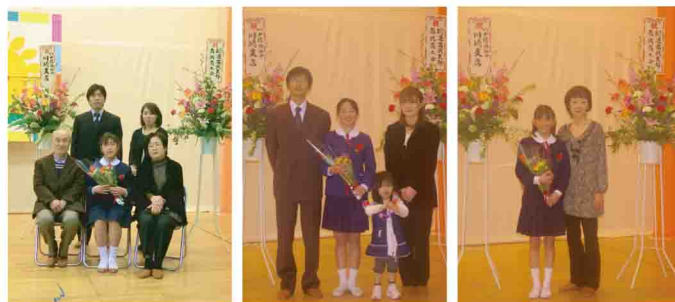
中学生になっても南武卒業生の誇りを持って!

南武学校の体育館にて初級学校第63回卒業式及び、付属幼稚園第46回卒園式が行われました。この日は卒業生たちを祝福するため、学父母はもちろん地域の同胞たちも大勢かけつけ祝福の拍手を送りました。