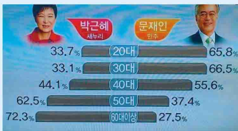
年代別得票率(上写真)

20代~40代では文候補。50代~60代以上では朴候補がそれぞれ多くの表を集めた。朴次期大統領は若い世代が次期政権に何を望んでいるか真摯に向き合わなければならない。