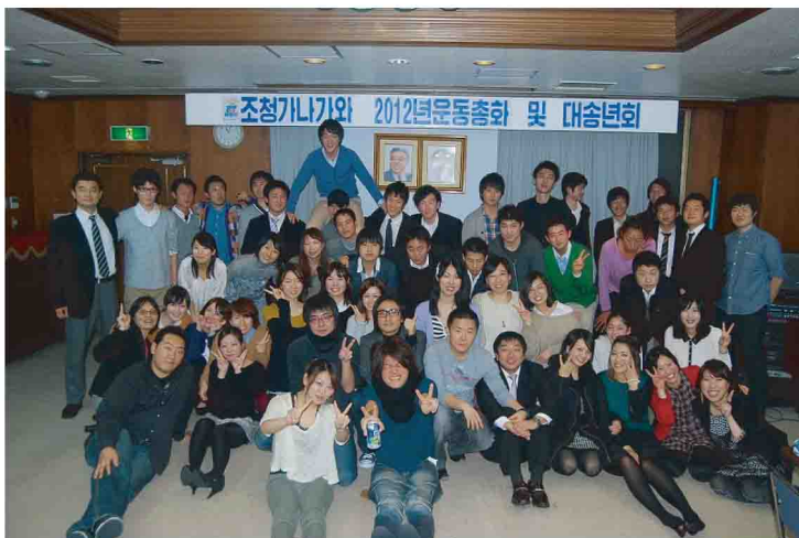
忘年会には日本の友人たちも参加しました☆

また、ユースフェスタで繋がった日本の方々も参加し、意義深い時間を送る事が出来ました。朝青支部は、2013年も奢ることなく定期大会にむけてまい進していきます!!