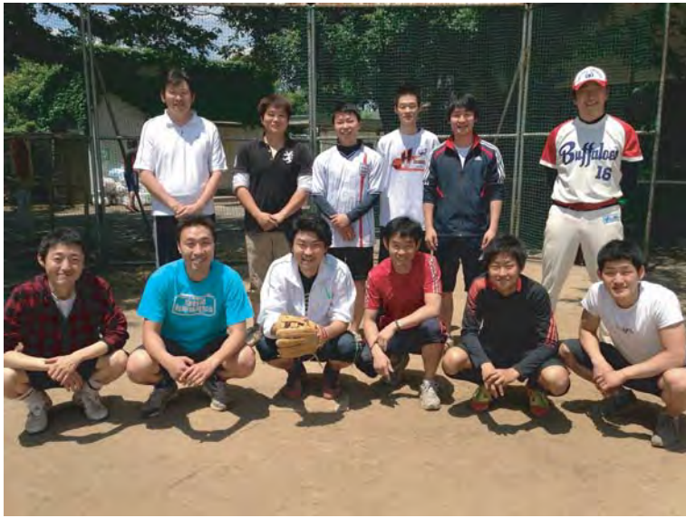
予選敗退でもこの笑顔! やりきった感半端じゃないです(笑)