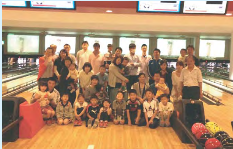
参加者たちで記念撮影！