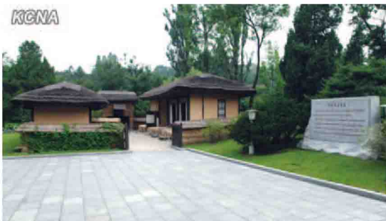
(写真は主席の生誕地、平壤市万景台)

4月15日(朝鮮ではこの日を『太陽節』という)にキムイルソン主席生誕100周年を迎えました。共和国では、今年の『太陽節』を世界に国力をとどろかせる重大な契機と位置づけ行事を「史上最大級の規模」で行っています。「4月春親善芸術祭典」など恒例行事も海外アーティストや在日をはじめとする海外同胞歌手、演奏家など20カ国から800人以上が参加しています。アメリカニューヨークのルビン美術博物館で朝鮮中央通信社と米国AP通信社が共催する写真展示会が開幕したのをはじめ、世界各国でもいろいろな行事が催されています。朝鮮の「ウナス(銀