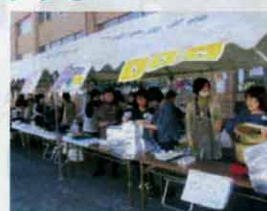
10/13(日) 富士森公園にて

例年より一ヶ月遅れての開催となった今回、趣向を変えて屋外で七輪焼きを囲み、総聯とニョメンの役員とともに朝鮮大学校の実習生たちもお手伝いにかけて、秋の陽気の下賑やかに行われました。数々のイベント出演でますますレベルアップしている「アリラン」チャンゴサークルの演奏には、お散歩中の市民の方も思わず足を止めて聞き入っていました。最後の民謡連曲では、初めて(!)男性陣のみなさんも踊りの輪に加わった愉快なひと時となりました。