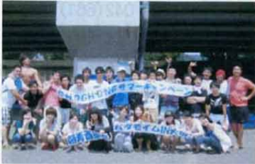
朝青西東京・パダ(海)モイム 7/21(日)・大磯