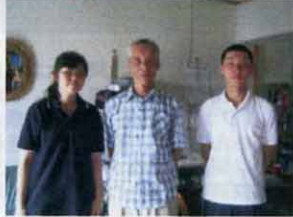
一世ハラボジのお話を聞く

真夏の猛暑の中、日本学校へ通う同胞学生対象のサマースクール(写真左)への動員活動、8月3日に行われた「8.15慶祝夜会」の案内(当日のお手伝い)、10.4宣言履行を求める署名集めなど、短期間に多くの実践をしました。