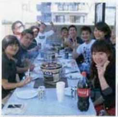
八王子朝青・焼き肉モイム 10/6(日)・西東京朝鮮会館屋上にて