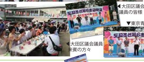
大田区議会議員 来賓の方々