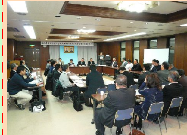
中高創立60周年記念実行委員会発足会 1/19

在日一世たちを思うと、単なる創立記念日だとは思えないでいます。日本の近代は朝鮮の植民地支配抜きには考えられません。その時代、「奴隷のように日本を生きぬいてきた」在日一世たちは、どのような思いで かんなんしんく 艱難辛苦を乗り越え、後世に朝鮮学校を建て民族教育を実施してきたのでしょうか。一世の多くが他界し、二世たちが70歳をこえてきている今、60周年記念を期に、我母校のこと、3世4世たちの将来のことを考えてみようと思います。